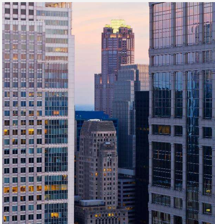
ניקוי מבני זכוכית