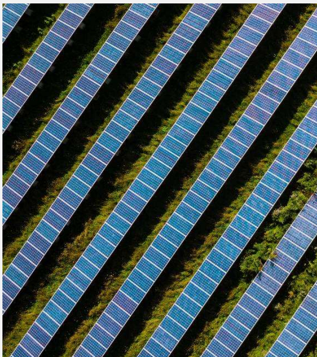
ניקוי שדות סולאריים